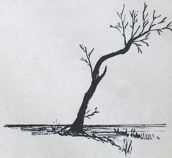
... Krom verboggelde ol krunen ...

Het is al weer verschillende jaren geleden dat we iets schreven over volksverhalen, overleveringen, enz. We willen deze pagina gebruiken om zoveel mogelijk verhalen, vertelsels, versjes en andere korte en leuke anekdotes te beschrijven, die betrekking hebben op Noord-Groningen. Vooral in de eerste helft van de eeuw waarin wij leven was er een toenemende interesse te bespeuren inzake beschrijvende folklore van het Groninger volk, maar ook van de verhalen volkskunde: de mythen, de legenden, sagen, het volksgeloof en de volkshumor. Als zodanig vormt 't tesamen een levend stuk gewestelijke kultuur. Veel van de groninger volksverhalen werden verzameld door de bekende mevrouw E. J. Huizinga-Onnekes te Ten Boer. Ze werd in 1883 geboren te Vierhuizen. Ze reisde heel Groningen door om zich de sprookjes en vertellingen etc. door de mensen te laten verhalen. In 1956 overleed ze op 73-jarige leeftijd.