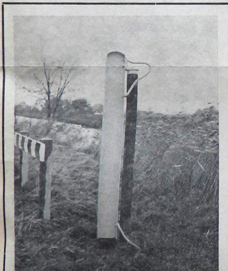
Een jaag- of rolpaal.

Vermeldenswaard is trouwens ook de weg waarop we nu rijden: het wegdek bestaat namelijk uit zogenaamde „kleinplaveisel”. Dit is uniek in de provincie. Kleinplaveisel wordt hier en daar nog sporadisch toegepast als sierbestrating, maar als „dienstdoend” wegdek komt het nog slechts hoogst zelden voor. Wellicht kan de wegbeheerder (de gemeente Bedum?) dit weggedeelte laten reconstrueren en aldus voor het nageslacht bewaren.