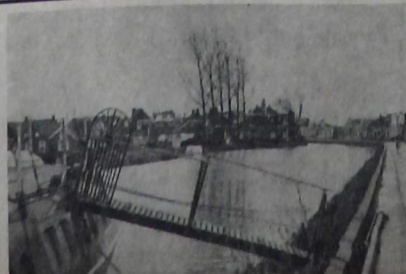
Het water wordt breder te Bedum.