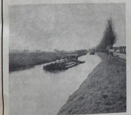
Toch nog scheepvaart . . . De heren Moret in komvoet op weg naar Uithuizen. Het Boterdiep bij Kantens.

We raden u aan ook eens een tocht langs het Boterdiep te maken. U zult dan ook tot de conclusie komen, dat land en water hier harmonieus samengaan. We hebben hier te maken met een stuk water waarin het Hogeland weerspiegelt: wanneer de winden aanwakken, worden de golven in het Boterdiep langer en hoger . . . Bij stralend en windstil zomerweer weerspiegelen de boerderijen en het vee langs de oevers in het rustige water. U wordt steeds weer getroffen door de prachtige vergezichten aan de overzijde van het diep. Zo trekt u langs het water door de vruchtbare kleistreken van dit gedeelte van de Ommelanden. Laten we hopen dat de wolken en lichten van de jaargetijden nog lang hun evenbeeld vinden in het water van ons onvolprezen Boterdiep.