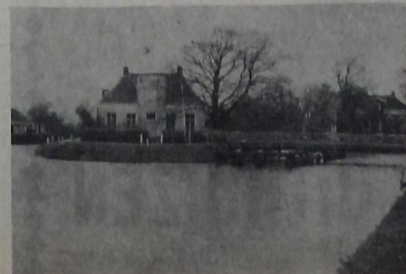
Onderdendam: knooppunt van waterwegen.