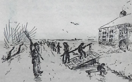
„Bat is oet”

Ook de winter van 1709 was zo streng en duurde erg lang. Van de winter van 1740 lazen we o.a. de volgende beschrijving: „Nu is het 11 januari en het vriest 20 graden. Het is zoo koud, dat de Kerke ontbloot van menschen bleef en sommigen die er toch gegaan waren met een beroerte op het lijf tehuis kwamen. Op den 16den februar was er tusschen Den Helder en Texel geen water meer te zien. Half mey is er nog geen blad aan de bomen en is ook geen gras, hetgeen de boeren in eenen ellendigen toestand brengt. Er zit op drie spaden diepte nog steeds veel vorst in de grond". Na 1740 kregen we nog de beruchte winters van 1823, 1830, 1890 en de wat ouderen onder ons zullen zich wellicht nog de winters van 1929, 1940 en 1947 herinneren.