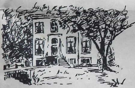
Breedenburg bij Breede