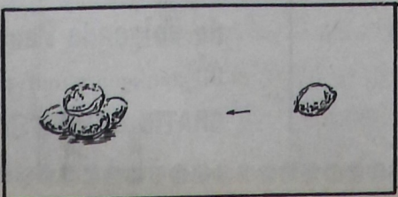
. . . Aibeltjen . . .

Architect J. J. Smith te Appingedam schreef ons, dat ook in Spijk een sarrieshut staat. 'Het pand staat op de lijst van Monumenten en is gelegen binnen dat gedeelte van het dorp Spijk, dat door het ministerie van C.R.M. als „beschermd dorpsgezicht" is verklaard'. Architect Smit vervolgt: 'Binnenkort zal met de restauratie worden begonnen' en in de schuur van het huis komen nog stallen voor, waarop de molenaar vroeger ossen mestte met dust, afkomstig van de pellerij'. Voor diegenen die Spijk niet kennen: het gaat hier om de sarrieshut aan de voet van de — nog in bedrijf zijnde — koren- en pelmolen 'Ceres' (1839). We zijn inmiddels benieuwd hoever de restauratieplannen zijn uitgevoerd.