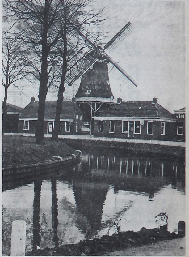
Sarrieshut en molen 'Ceres' te Spijk