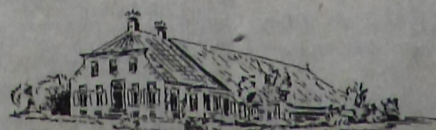
't Oldambster spul

Tot zover eerst het interieur van een boerderij in de vorige eeuw. De volgende keer komen we hier uitgebreider op terug.